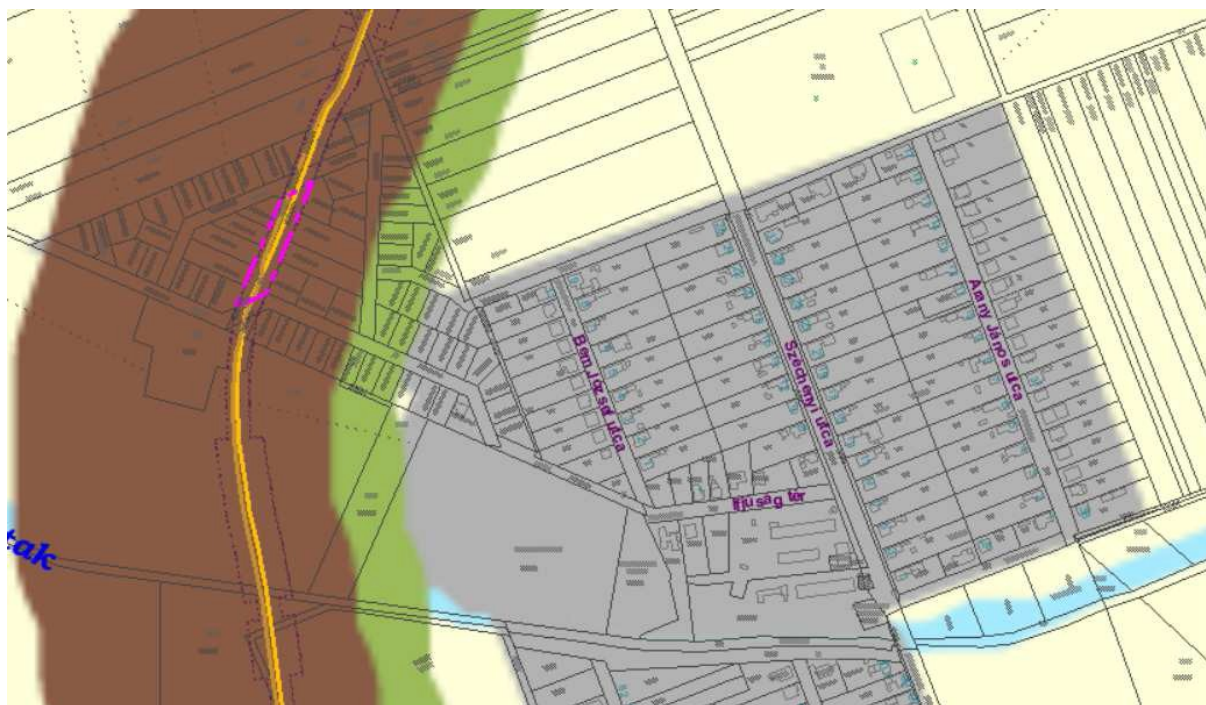
MATrT Szerkezeti terv kivágata

► Az 1. sz. módosítás települési térséget érint, így a PMTrT-nek ez a módosítás megfelel.