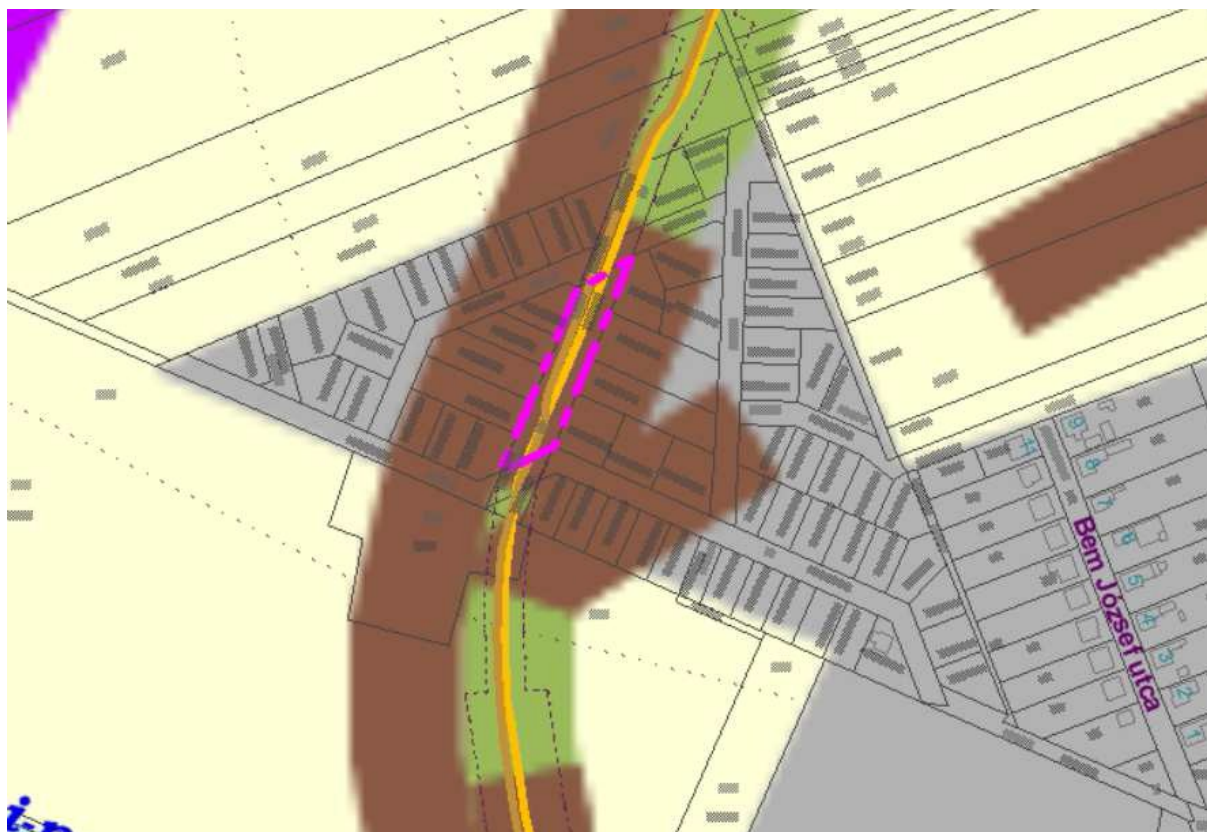
PMTrT Szerkezeti terv kivágata